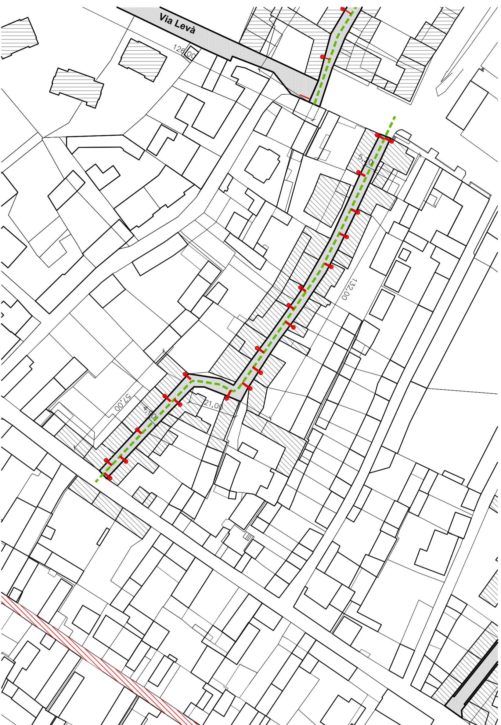
Planimetria intervento via Beneficio Villa scala 1:1000